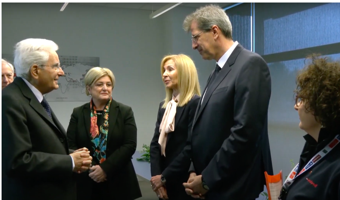
Da sinistra, Sergio Mattarella, il ministro Marina Calderone e i vertici di Walvoil durante l'incontro nella sede di Reggio Emilia

Tappa successiva nella giornata presidenziale, la sede di un'altra eccellenza che conosciamo bene. Per Mattarella si sono aperti i cancelli della Walvoil di Reggio Emilia – espositore in primo piano , quest'anno, al GIS , le Giornate del Sollevamento organizzate da Mediapoint & Exhibitions a Piacenza Expo, dal 5 al 7 ottobre – per un incontro straordinario organizzato da Unindustria Reggio Emilia che ha visto la partecipazione delle delegazioni di imprese e lavoratori del territorio. 300 ospiti , con la presenza solenne delle istituzioni locali e del ministro del Lavoro, Marina Calderone .