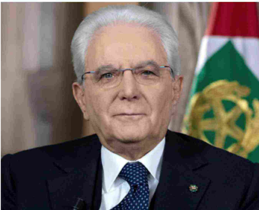
Il Presidente della Repubblica Sergio Mattarella