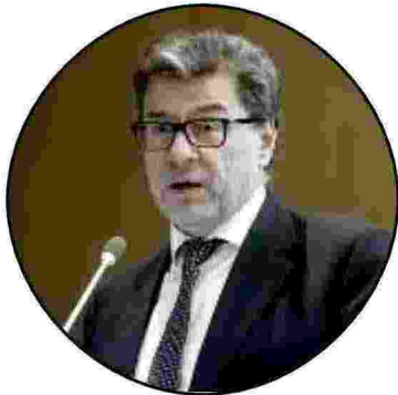
Giancarlo Giorgetti Ministro dell'economia e finanza

L'evento è organizzato da Unindustria e si inserisce nell'ambito delle iniziative in onore del prossimo Primo maggio, festa dei lavoratori